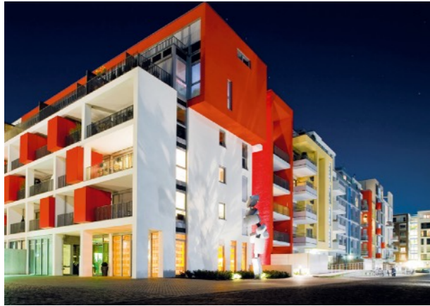
Quartis LesHalles, Düsseldorf-Derendorf Zeitraum: 2003 - 2007

Vertrauensgeber: Interboden Lebenswelten GmbH