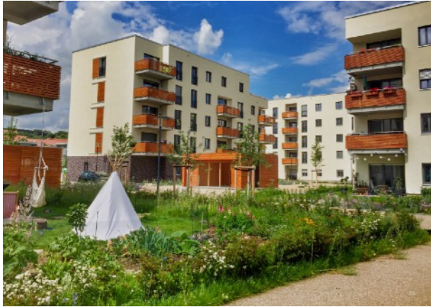
IMMERGRÜN, Jena-Nord Zeitraum: 2015 - 2016