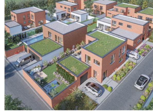
HOFGÄRTEN, Düren bei Köln Zeitraum: 2019 - 2020 ff

Vertrauensgeber: NW Bauland GmbH, Kern-Haus GmbH