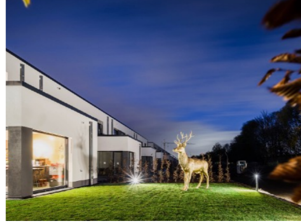
Die LICHTUNG, Köln-Lövenich Zeitraum: 2013 - 2014