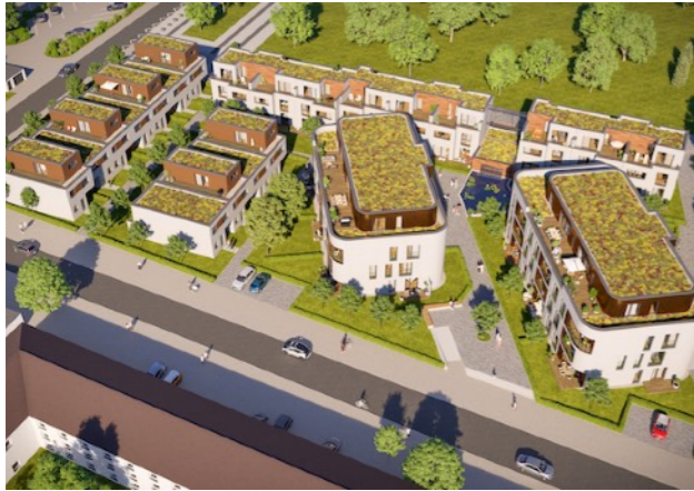
LILY'S, Bad Neuenahr-Ahrweiler Zeitraum: 2021 - 2022 ff

Vertrauensgeber: Doetsch & Hellinger Immobilien GmbH