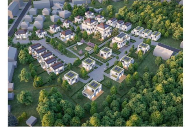
DORLOH PlusQuartier, Castrop-Rauxel Zeitraum: 2021 - 2023 ff

Vertrauensgeber: Deutsche Bauland- u. Quartierentw. GmbH