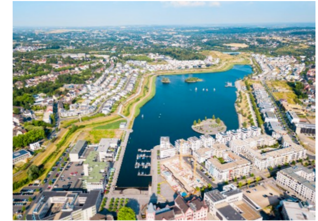
PHOENIX See, Dortmund-Hörde Zeitraum: 2008 - 2011

Vertrauensgeber: Phoenixsee Entwicklungsgesellschaft mbH