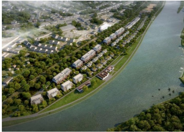
Kettwiger Ruhrbogen, Essen-Kettwig Zeitraum: 2012 - 2014

Vertrauensgeber: Ten Brinke Wohnungsbau GmbH