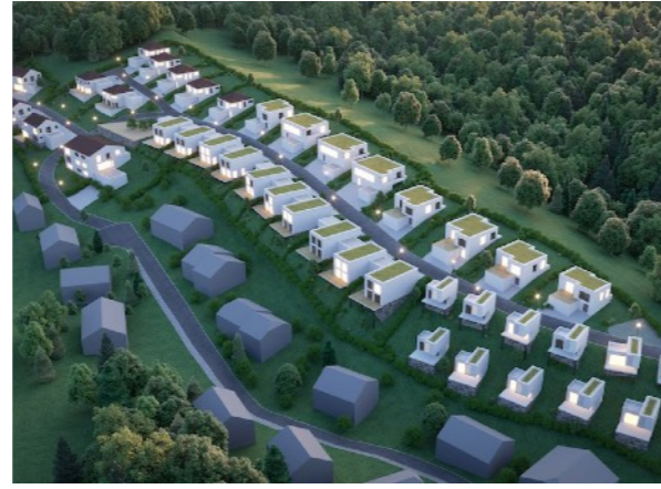
ALLMENTURA, Sasbachwalden Zeitraum: 2021 - 2022 ff

Vertrauensgeber: Allmentura GmbH, Kern-Haus Süd GmbH