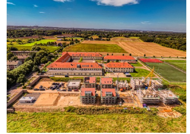
GEORGE'S, Köln-Rondorf Zeitraum: 2019 - 2020 ff

Vertrauensgeber: Doetsch & Hellinger GmbH, Kern-Haus GmbH