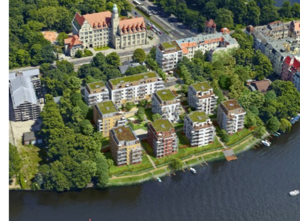
UFERKRONE, Berlin-Köpenick Zeitraum: 2013 - 2014