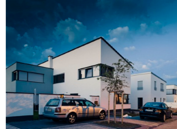
rondo am Wachtberg, Bonn-Wachtberg Zeitraum: 2005 - 2009

Vertrauensgeber: WGZ Immobilien + Treuhand GmbH