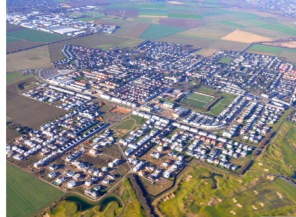
Prima Colonia, Köln-Widdersdorf Zeitraum: 2005 - 2014

Vertrauensgeber: Amand Projektentwicklung GmbH