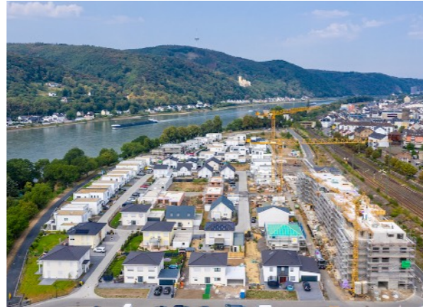
RHEINQUARTIER, Lahnstein bei Koblenz Zeitraum: 2015 - 2020

Vertrauensgeber: Rheinquartier GmbH, Kern-Haus AG