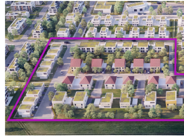
VICUS QUARTIER, Nörvenich bei Köln Zeitraum: 2021 - 2022 ff

Vertrauensgeber: Kern-Haus Köln-Bonn, GmbH, F&S concept